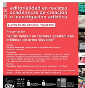
Lunes 19 de octubre, 18:30 hrs: "Editorialidad en revistas académicas chilenas de artes visuales: resultados preliminares de un estudio"