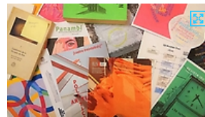
El Ciclo "Editorialidad en revistas de creación e investigación artística", busca ser un espacio para dar a conocer algunas evoluciones centrales de la editorialidad y visualizarla en el futuro.

En este nuevo paradigma, los rankings globales de universidades se construyen a partir de los indicadores de publicación en revistas indexadas, es decir, incluidas en listados que certifican su calidad. Aunque existan intereses y circuitos alternativos, el sistema se organiza muy jerárquicamente, en detrimento de las periferias geolingüísticas y disciplinarias. Además, es un sistema complejo. Incluso desde las artes, la edición no solo concierne a eventuales formatos híbridos, sino también a procesos de gestión editorial y soportes tecnológicos. Por eso concibo la edición en sí misma como una práctica experimental que permite adentrarse en los engranajes del sistema y probar sus límites. Sin embargo, sus transformaciones solo pueden venir de la mano de iniciativas mancomunadas y un encuentro como este permite que estas iniciativas emerjan.