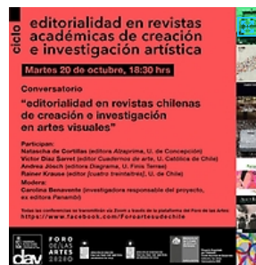
Martes 20 de octubre, 18:30 hrs: "Editorialidad en revistas chilenas de creación e investigación en artes visuales"