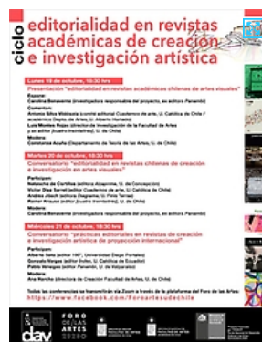
Esta actividad se desarrollará el 19, 20 y 21 de octubre y busca ser un espacio para dar a conocer algunas evoluciones centrales de la editorialidad y visualizar esta práctica en el futuro.